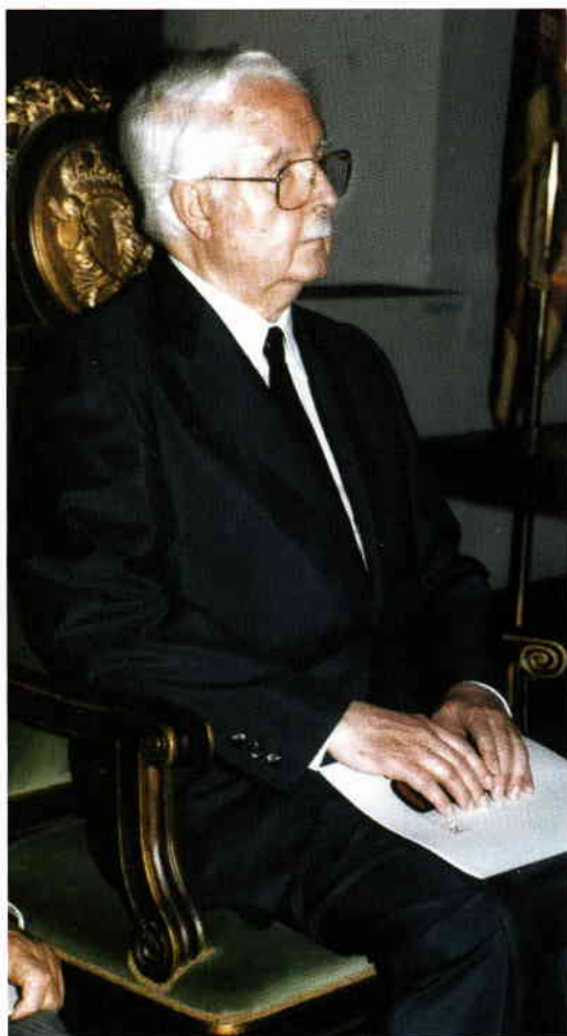
Acadèmic d'Honor de la Reial Acadèmia de Belles Arts de Sant Carles de València, 1999.

XVI. Sus influencias políticas en la Diputación de Valencia en el Primer Congrés d'Història del País Valencià que es publicaria en 1976, on Orts i Bosch explica la influència dels representants eclesiàstics en la Diputació de València i la situació inestable atravesada per la noblesa al llarg dels segles XIV i XV que li comportaria la inoperància com a estament militar durant el segle XVI. Per a il·lustrar la primera circumstància, aporta dues cartes que el virrei Vespasià Gonzaga i Colonna va transmetre a Felip II, sobre la conveniència de què el càrrec de representant eclesiàstic en la Diputació de València passara a mans d'algú que no fóra valencià, encara que sí que deuria ser persona submissa als interessos de la Corona, interessos que no solien coincidir amb els que tenia el poble. En les dues cartes es pot apreciar la maniobra que tramava el virrei per a allunyar de la Diputació a fra Valeriola, prior del monasteri de Sant Miquel dels Reis en 1576 i representant eclesiàstic en la Diputació, persona de grans sabers i fidel als Furs, el