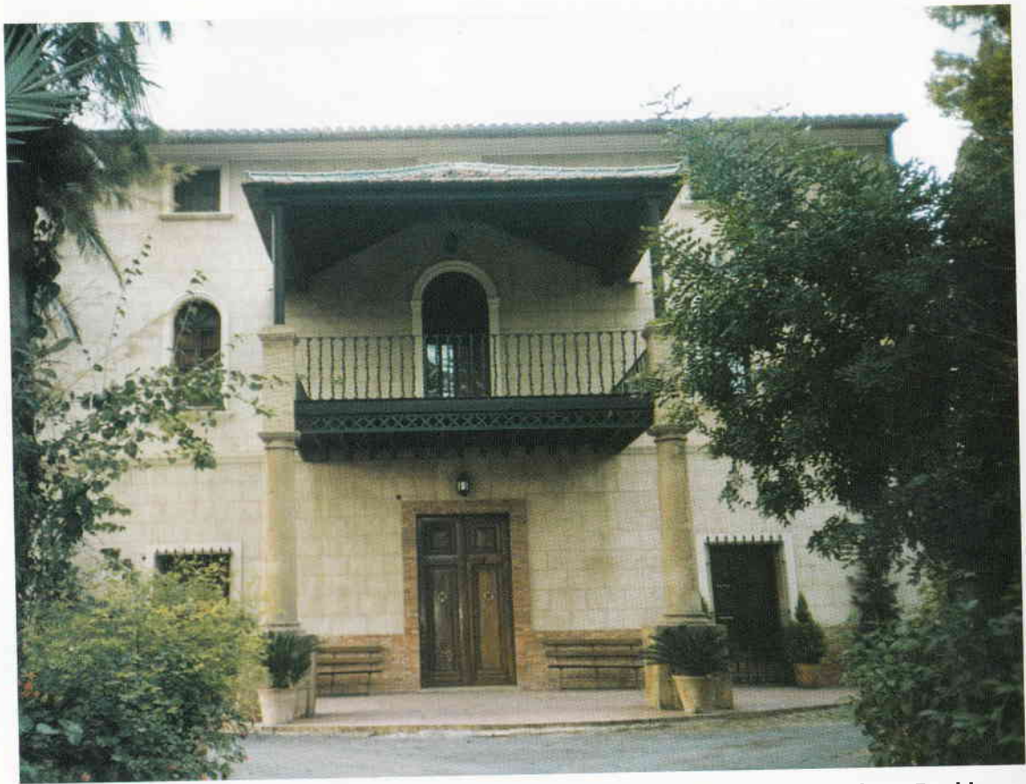
Casa familiar a Benidorm.