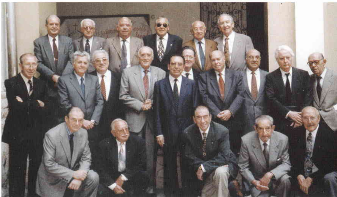
Antics alumnes. Escoles Pies. València, 1995.

d'aquesta ciutat l'any 1945. Els lligams familiars i la relació continuada amb Benidorm han influït de manera decisiva perquè una part de la seua obra tinga Benidorm com a centre dels seus estudis d'investigació.