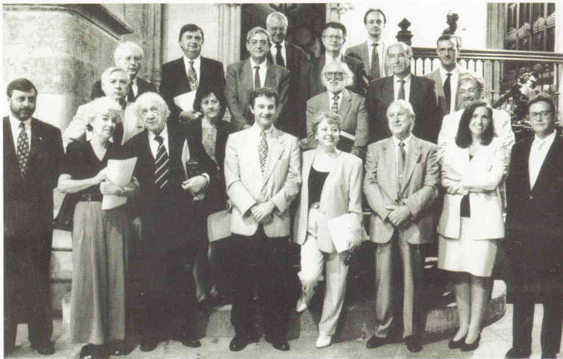
Patronat del Museu de Sant Pius V o de Belles Arts de València.

qual no es doblegava a les exigències dels virreis i de la Corona. Per a explicar la segona circumstància al·ludida, estudia les causes que van dur la noblesa a tal situació.