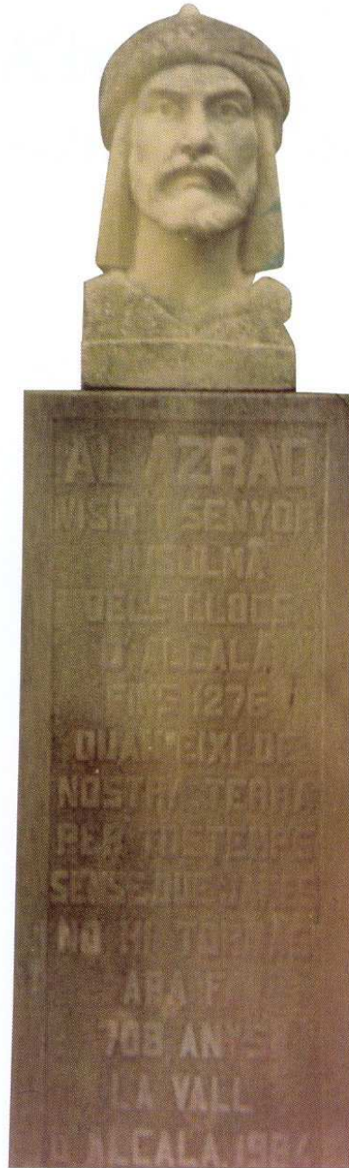
Escultura del cabdill musulmà Al/Araq (Alcalà de la Jovada)

La situació va arribar a un moment de greu conflicte el 1244, un any que va resultar clau en la conquesta i en la rivalitat entre les dos potències cristianes. Jaume I va aconseguir mantenir el projecte dels seus avantpassats: va assetjar amb èxit Dénia (presa en maig del 1244), Xàtiva (presa en maig del 1244) i Biar (presa en febrer del 1245, al cap de 5 mesos) i va fer un pacte avantatjós amb l'aristòcrata mudèjar Alazrac que s'havia revoltat en les muntanyes que hi ha entre Biar i Dénia (tractat del Pouet, en abril del 1244). Tan sols se li va escapar una cosa, per les maquinacions del sayyid Abusaïd, l'últim rei almohade de València, que va fer un doble joc amb Jaume I i amb Alfonso X. Havia promès conquerir terres per a Jaume I en el regne de València,