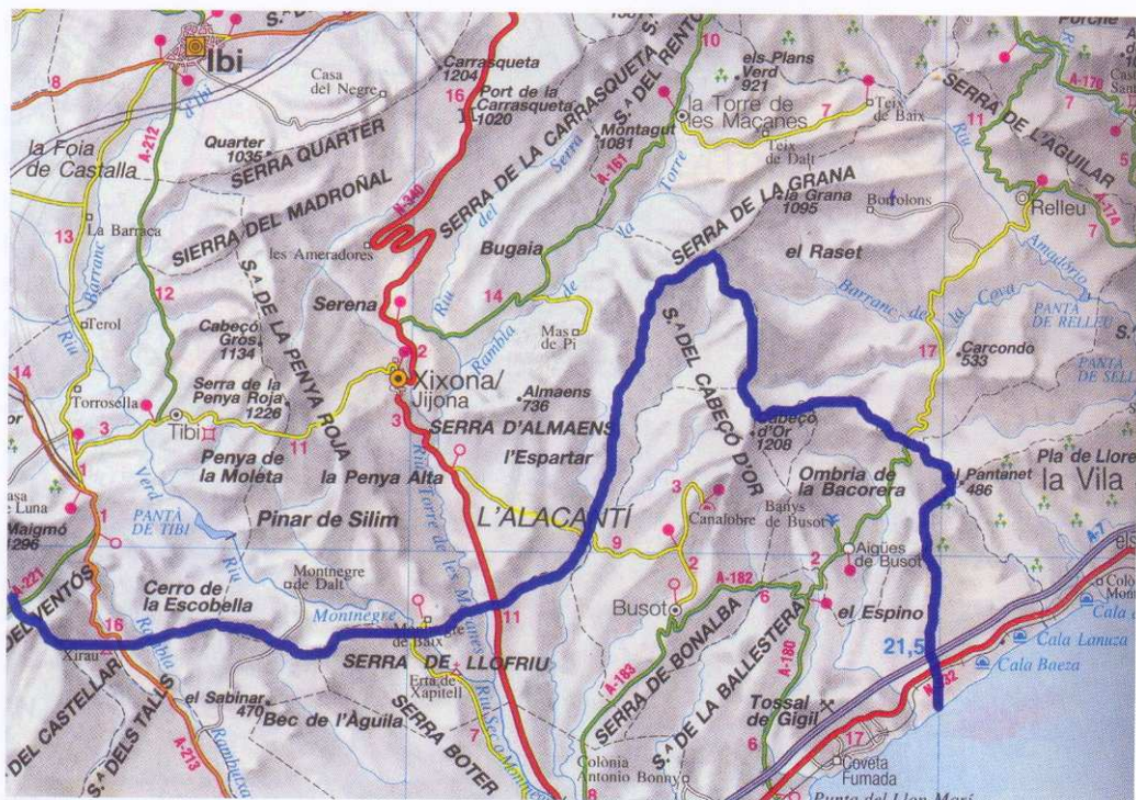
Figura 3. L'extrem de la frontera. Traçat de la frontera d'Almistrà a prop de la mar, deixant les conques dels rius de Busot i d'Aigües a la banda de l'Alacant encara castellà.

lar el seus termes, va aconseguir arravatar-li a Vilajoiosa el territori a ponent del barranc del Carritxal i fins al riu d'Aigües, malgrat que els vilers van aportar la documentació medieval del tractat d'Almistrà (Galiana 2010b).