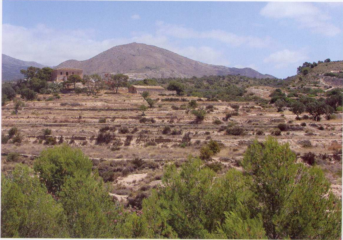
Figura 5. Vista actual de l'Almiserà. Foto que mostra els bancals abandonats i la casa dels antics propietaris als segles XIX-XX.