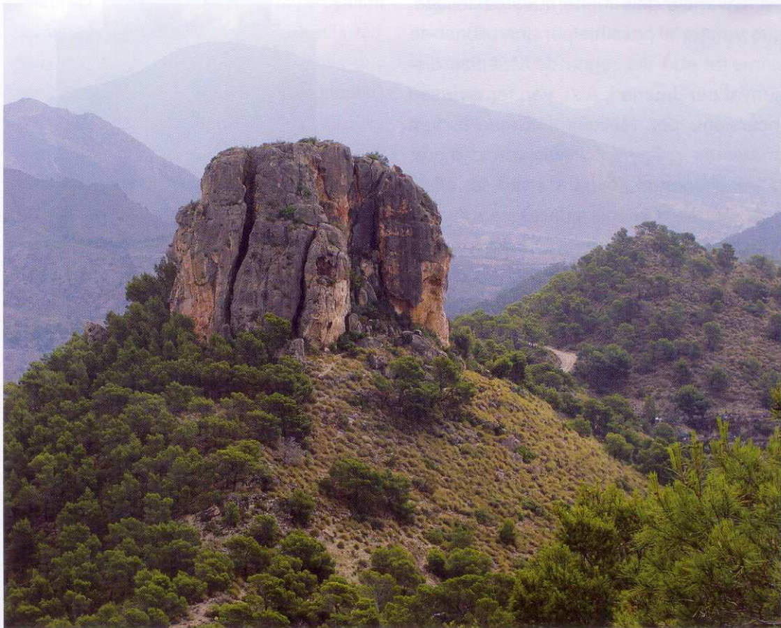
Figura 1. El Cantal de la Mola. Penya calcària en la fita entre Orxeta, Vilajoiosa i Aigües. Tot i no ser molt gran ni molt alta (486 m), destaca poderosament en el paisatge. És “la Mola a prop d’Aigües” dels textos medievals.

AGUSTÍ GALIANA Associació d'Estudis de la Marina Baixa www.aemaba.com